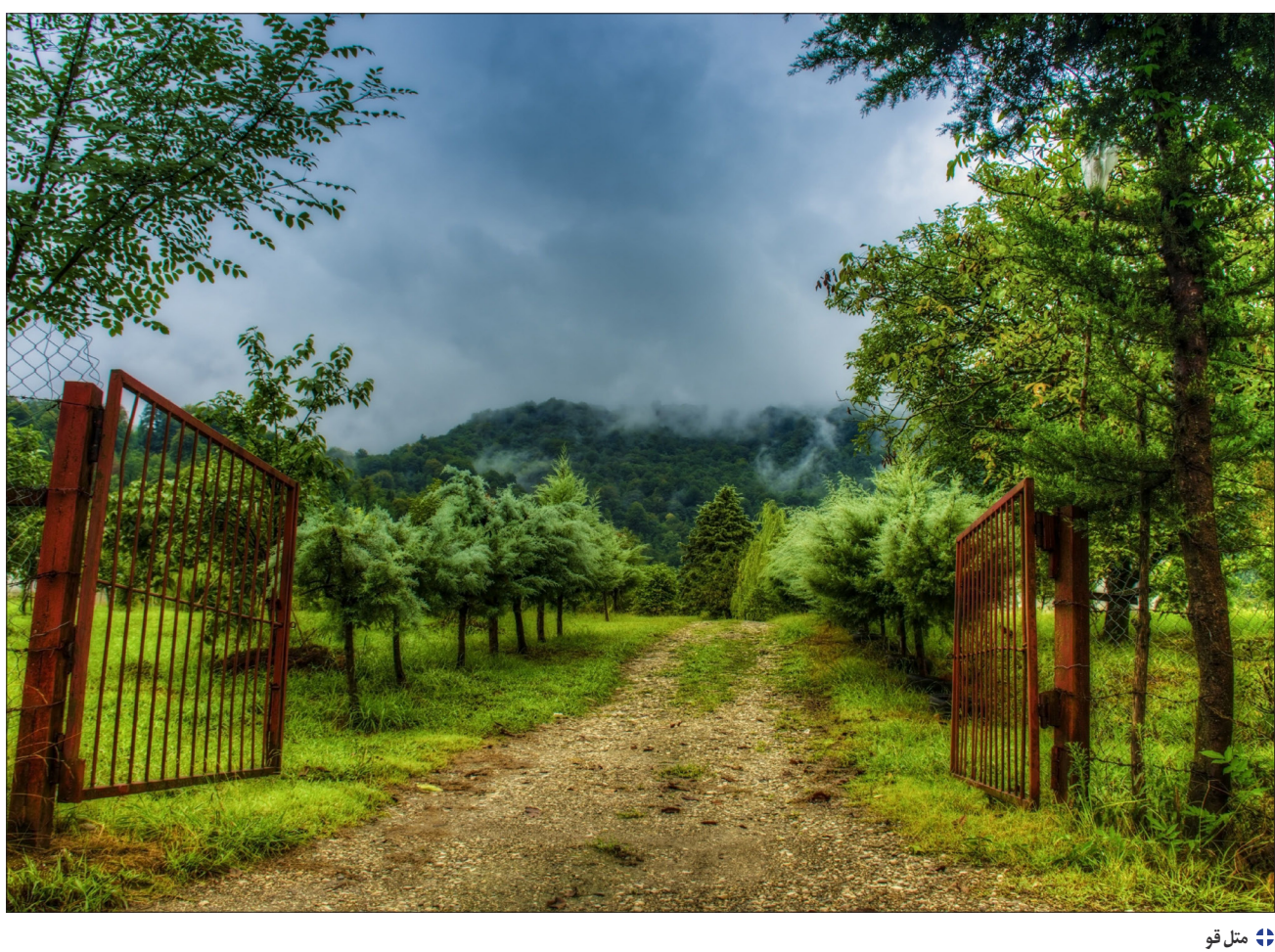
📍 مثل قو

در نهایت با تصویب تغییر سرود ملی، فراخوانی به این منظور منتشر و از حدود ۲۵ نفر از آهنگسازان برای شرکت در این فراخوان دعوت شد. در نهایت حدود ۶۸ اثر به دبیرخانه ای که به این منظور در صدا و سیما تشکیل شده بود، ارسال شد. به نوشته زنده یاد مشفق کاشانی، «از بین تعداد زیادی آهنگ که توسط آهنگسازان مشهور آماده شد، تنها آهنگ استاد فرزانه دکتر ریاحی که اجرای آن ۵۹ ثانیه وقت می گیرد مورد تصویب قرار گرفت. سپس از میان ۱۰-۱۲ شعری که توسط شاعران عضو شورای عالی شعر صدا و سیما براساس ملودی مورد بحث سروده شده بود، «سرود ساعد باقری» به اتفاق آرای انتخاب و با تغییرات جزئی آماده اجرا گردید.» محمد هاشمی رییس وقت سازمان صداوسیما بیست و هفتم اردیبهشت ۱۳۷۱ نمایای به رهبر معظم انقلاب می نویسد و ضمن ارائه توضیحاتی درباره نحوه ساخت سرود ملی جدید، از ایشان اجازه می خواهد که به مناسبت سوم خرداد سالروز فتح خرمشهر این سرود پخش شود. در پیام رهبر شهید انقلاب آمده بود: «با پیشنهاد موافقت می شود. خوب است مضامین انقلابی سرود جدید در طول این ایام برای ملت آگاه و هوشیارمان تشریح شود.» در نهایت در شب سوم خرداد ماه سال ۱۳۷۱، همزمان با سالروز فتح خرمشهر، سرود ملی جدید برای اولین بار پخش می شود.