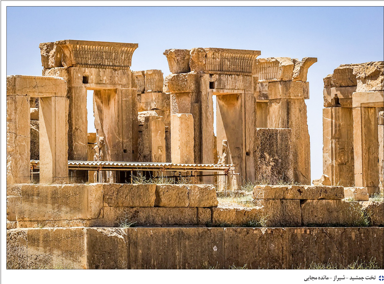
تخت جمشید - شیراز - مانده مجابی

«مهتاب» فقط درباره یک کشور یا دوره خاص نیست، بلکه درباره وضعیت انسانی تحت فشار ساختارهایی است که آزادی و بیان فردی را محدود می‌کنند. این کتاب نمونه‌ای از روشمند از ادبیات اروپای شرقی است که از استعاره به‌عنوان ابزار روایت استفاده می‌کند.