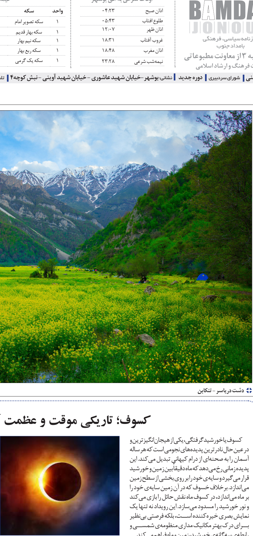
☞ دشت دریا سر - تکابین

کسوف یاخورشید گرفتگی،یکی ازهیجان‌انگیزترین