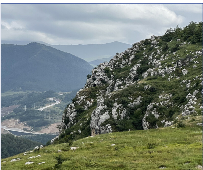
منطقه اکو عمل می‌کند.

معاون دبیر کل اکو بر اهمیت تحقیق، آموزش و ظرفیت‌سازی، به ویژه برای متخصصان جوان و نقش رو به رشد فناوری‌های دیجیتال در تحول بخش گردشگری تأکید و اظهار کرد: نوآوری باید با پایداری همراه باشد و حفاظت از میراث طبیعی و فرهنگی را تضمین کند.