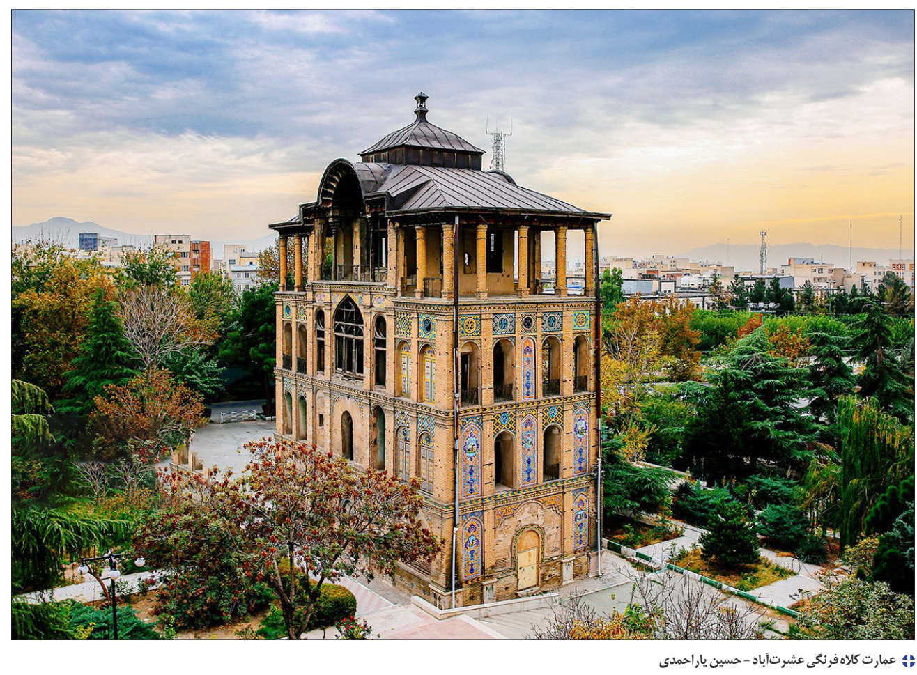
❖ عمارت کلاه فرنگی عشرت‌آباد - حسین یاراحمدی

سید محمدحسن بن سید محمد، مشهور به آقاجنقی قوچانی، صاحب کتاب‌های سیاحت غرب، سیاحت شرق، اثبات رجعت و شرح و ترجمه رساله تفاحیه‌ارسطو در ۶۷ سالگی درگذشت.