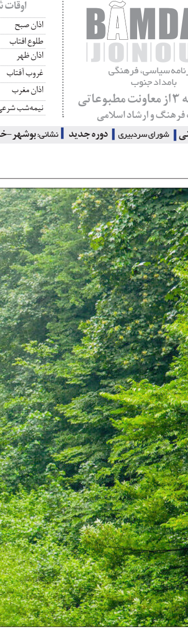
طبیعت بهاری سوادکوه - مازندران - حسن عیسی پور

درگیری میان موافقان و مخالفان محمد مصدق در شیراز عده‌ای کشته و مجروح بر جای گذاشت.