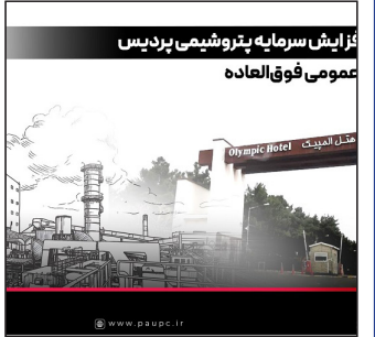
افزایش سرمایه پتروشیمی پردیس عمومی فوق‌العاده