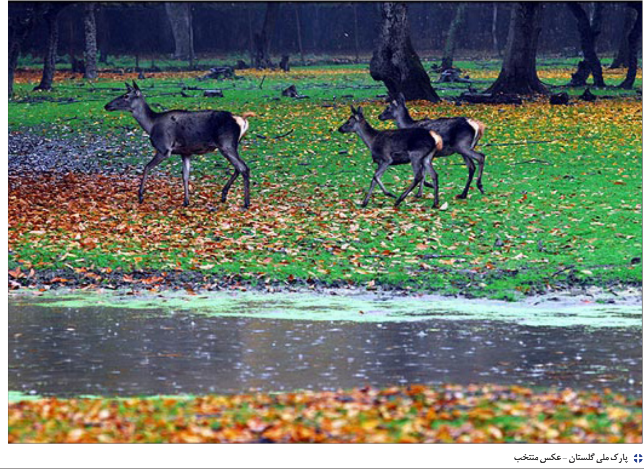
👉 پارک ملی گلستان - عکس منتخب

سبک نگارش کامو ساده، مستقیم و بدون احساسات اضافی است، اما همین سادگی به شکلی استادانه حس بی تفاوتی و سردی درونی قهرمان را منتقل می کند. در نهایت، مرسو در آستانه ی مرگ به معنای آزادی و رهایی می رسد، زیرا می پذیرد که جهان فاقد معناست. اما همین آگاهی او را از ترس رها می سازد. «بیگانه» بازتابی از تفکر فلسفی کامو درباره ی انسان مدرن است؛ انسانی تنها، بی هدف، اما آگاه از پوچی جهان.