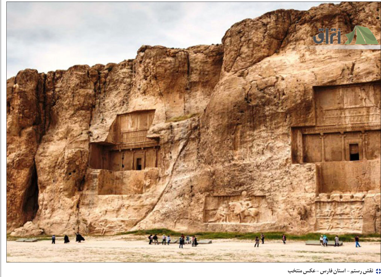
نقش رستم - استان فارس - عکس منتخب