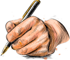
تصویر یک دست که با یک قلم می‌نویسد.

مت هیگ، زاده ی ۳ جولای ۱۹۷۵، رمان نویس و روزنامه نگار انگلیسی است. هیگ در شفیلد به دنیا آمد. او در دانشگاه‌ها ل به تحصیل در رشته ی زبان انگلیسی و تاریخ پرداخت. هیگ تا به حال آثاری داستانی و غیرداستانی را هم برای کودکان و هم برای بزرگسالان در رشته ی تحریر در آورده‌است. او در بیست و چهار سالگی به افسردگی شدیدی مبتلا شد اما توانست آن را پشت سر بگذارد.