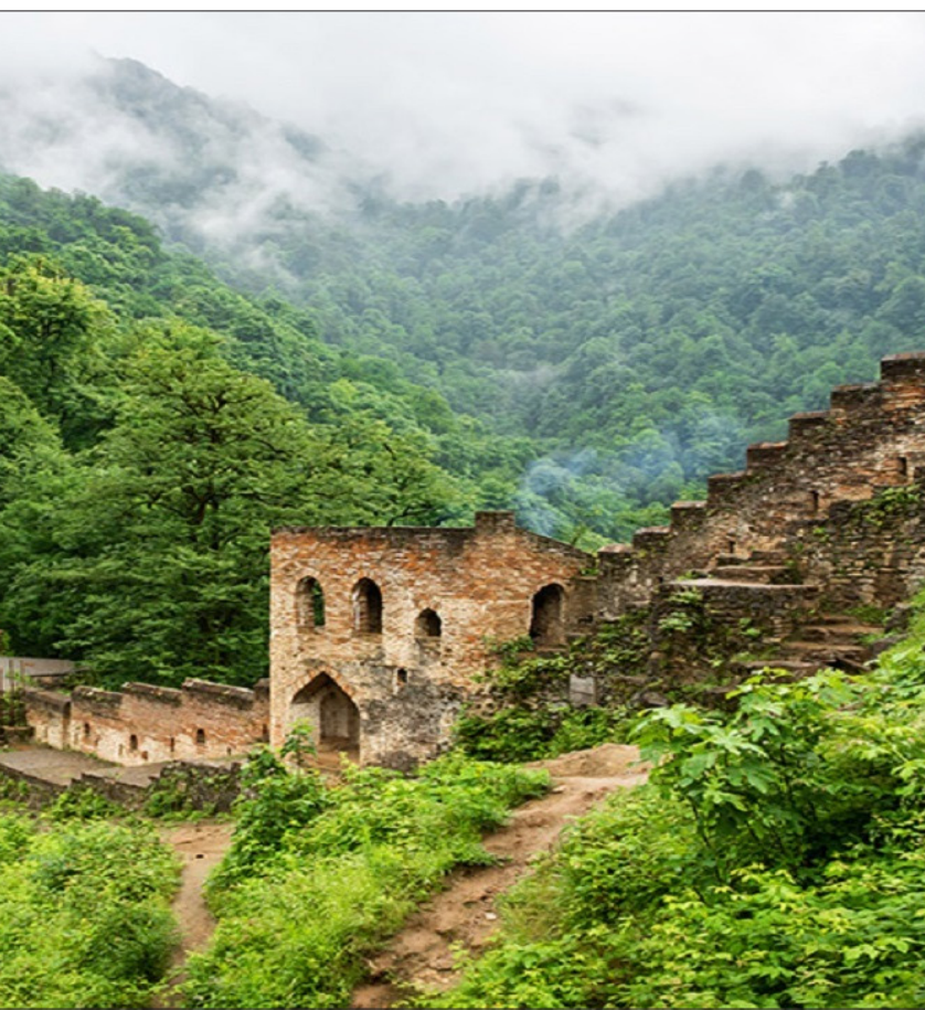
دژ رودخان؛ متعلق به دوره امپراتوری ساسانی – شهرستان فومن در روستای رودخان – عکس منتخب

اطلس را حکایت می‌کند. در این رمان، همینگوی با سبکی معاصر که بسیار برجسته و قابل توجه‌است، موضوعاتی کلاسیک از قبیل جرات و شجاعت در مواجهه با شکست و رسیدن دوباره به هدف را طرح ریزی کرده و به شکلی جدید به مخاطب عرضه می‌کند. این رمان بسیار موفق که در سال ۱۹۵۲ نوشته شده‌است، قدرت و جایگاه همینگوی را در دنیای ادبیات به تثبیت رساند و نقشی اساسی در کسب جایزه‌ی نوبل ادبیات در سال ۱۹۵۴، برای نویسنده‌اش ایفا کرد. منتقدان، نوشتن کتاب «رمان پیرمرد و دریا» را در دنیای ادبیات برابر با اختراع پیل الکتریکی در دنیای علم قلمداد کرده‌اند. کتاب مشهوری که حالا از آن به عنوان شاهکاری از ادبیات قرن بیستم یاد می‌شود. همینگوی در جایی گفته بود: «اولین نسخه‌ا‌هر اثر مزخرف است» او به بازنویسی آثارش بسیار اعتقاد داشت و هر بار به بررسی دوباره اثر می‌پرداخت. مشهور است که می‌گویند همینگوی این اثر را بالغ بر دویست بار بازنویسی کرده‌است. همین روحیه‌ی سخت‌کوشی نویسنده بود که باعث شد شاهکار رمان پیرمرد و دریا خلق شود.