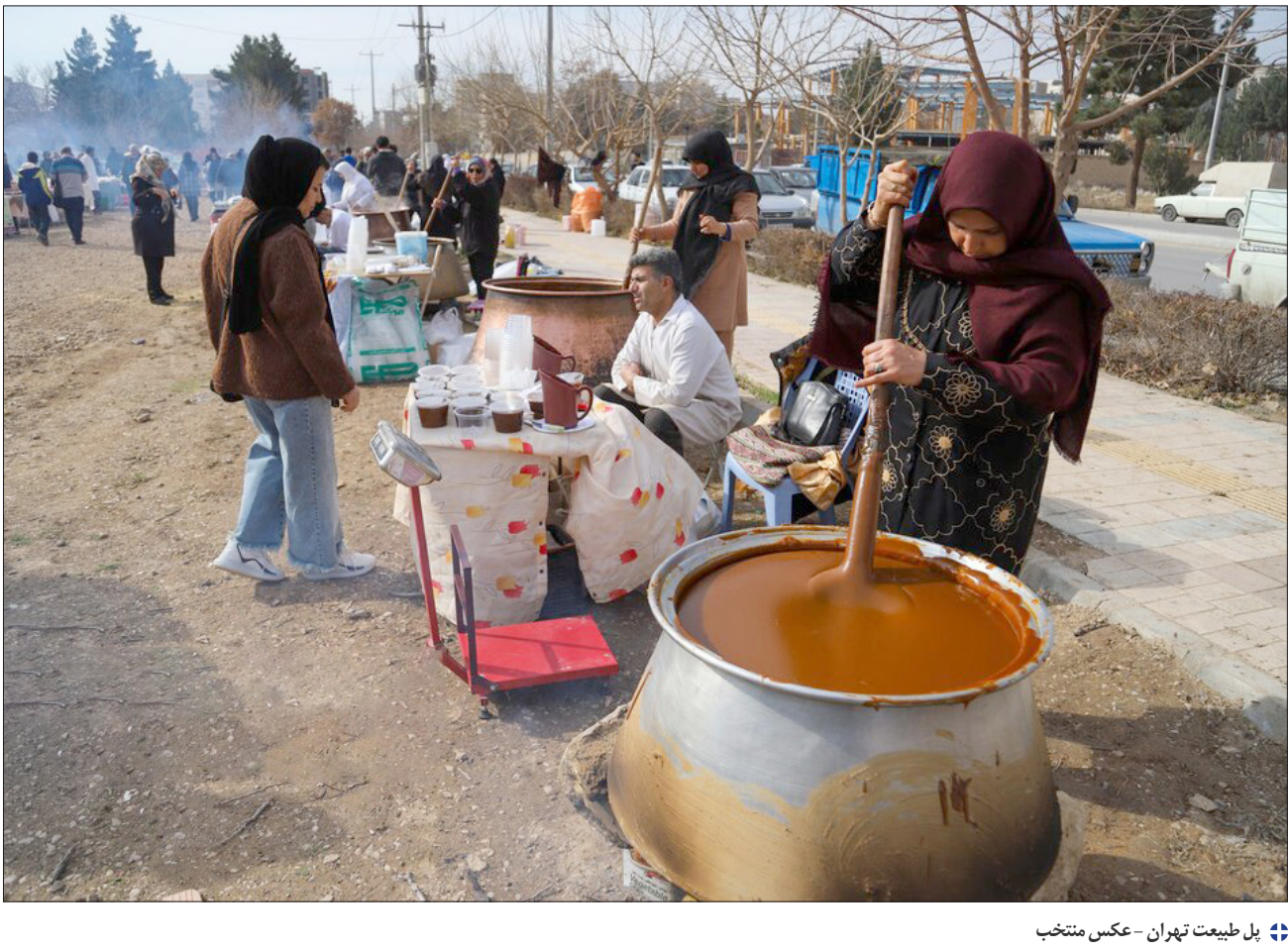
پل طبیعت تهران - عکس منتخب