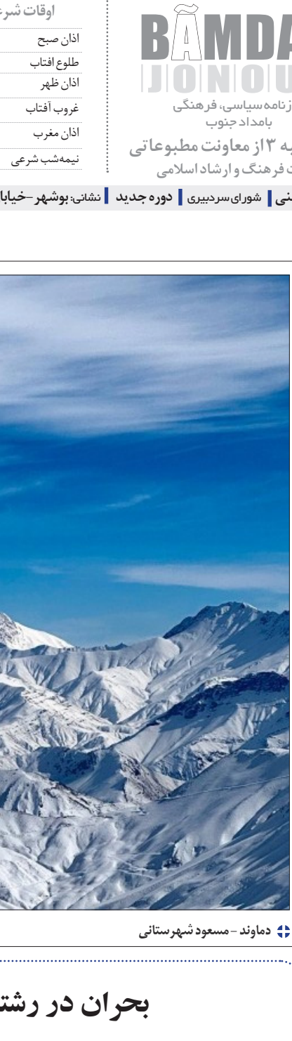
۴ ماوند - مسعود شهرستانی

آرتور میلیسیوپو وزیر اداری امور مالی ایران وارد تهران شد. وی در سال‌های ۱۳۰۱ تا ۱۳۰۴ خورشیدی همراه با هیأت کارشناسان مالی آمریکا در ایران فعالیت کرده بود.