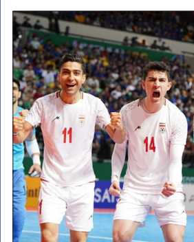
فوتسال ایران قهرمان آسیا شد