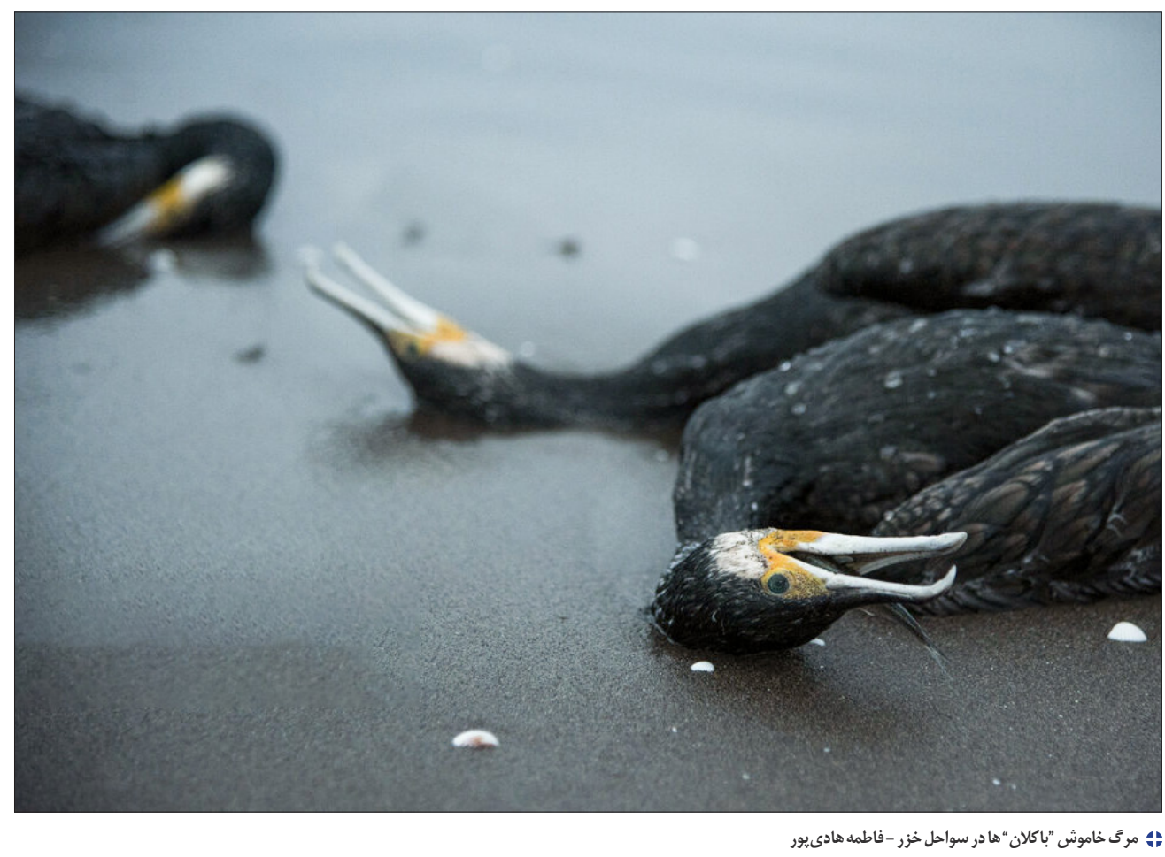
➤ مرگ خاموش "بالکان" ها در سواحل خزر - فاطمه هادی پور

حسن مستوفی (مستوفی الممالک) کابینه تازه خود را به رضاخان معرفی کرد. در این کابینه که تا پنجم خرداد ۱۳۰۶ هجری خورشیدی دایر بود، ذکاء الملک فروغی، در پی به سلطنت رسیدن رضاخان به عنوان وزیر جنگ انتخاب شد.