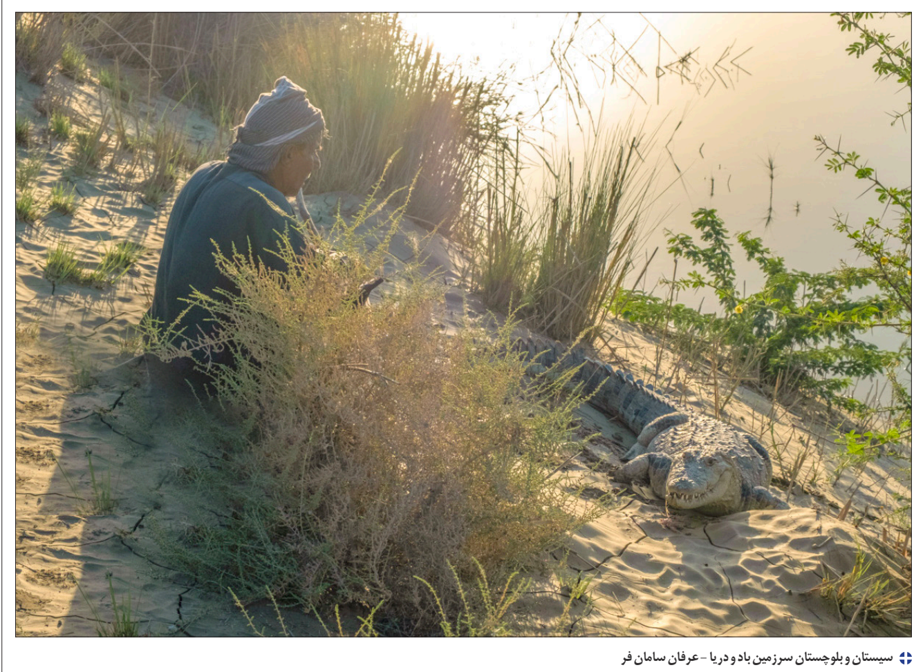
❖ سیستان و بلوچستان سرزمین باد و دریا - عرفان سامان فر

گفت «اختیار دارین. معذرت از ماس.» و روشن کرد. من هم سوار شدم راه افتادم.